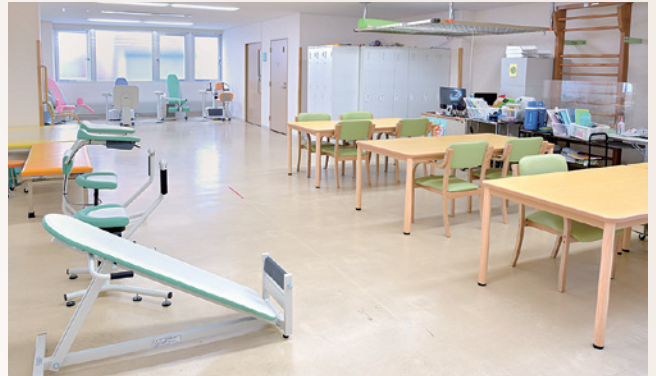
リハビリマシン4台、ストレッチ補助器具3台、エアロバイク1台を備えています

デイケア（通所リハビリ）は、リハビリを必要とする要介護者が介護保険を使って利用する介護サービスです。柏葉脳神経外科病院に併設するデイケアセンター「笑るむ」では、運動機能の維持・回復、認知機能の活性化、誤嚥の予防、コミュニケーション能力の維持・回復に向けて理学療法士、作業療法士、言語聴覚士によるリハビリを提供しています。